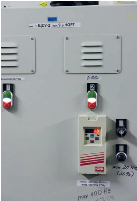
Abb. 5: Manuelle Option für die Einstellung der Frequenzumrichter

doppeltwirkenden Gleitringdichtungen und Spülsystemen nach API Plan 54 ausgerüstet.