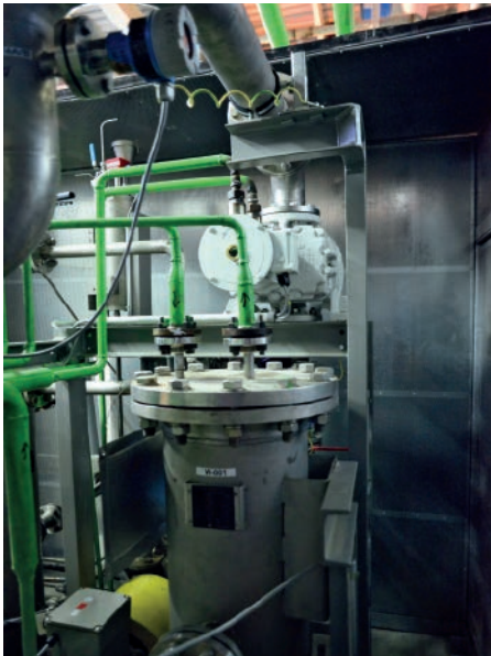
Abb. 2: Zwischenkühler zur Gewährleistung der vorgegebenen Maximaltemperatur