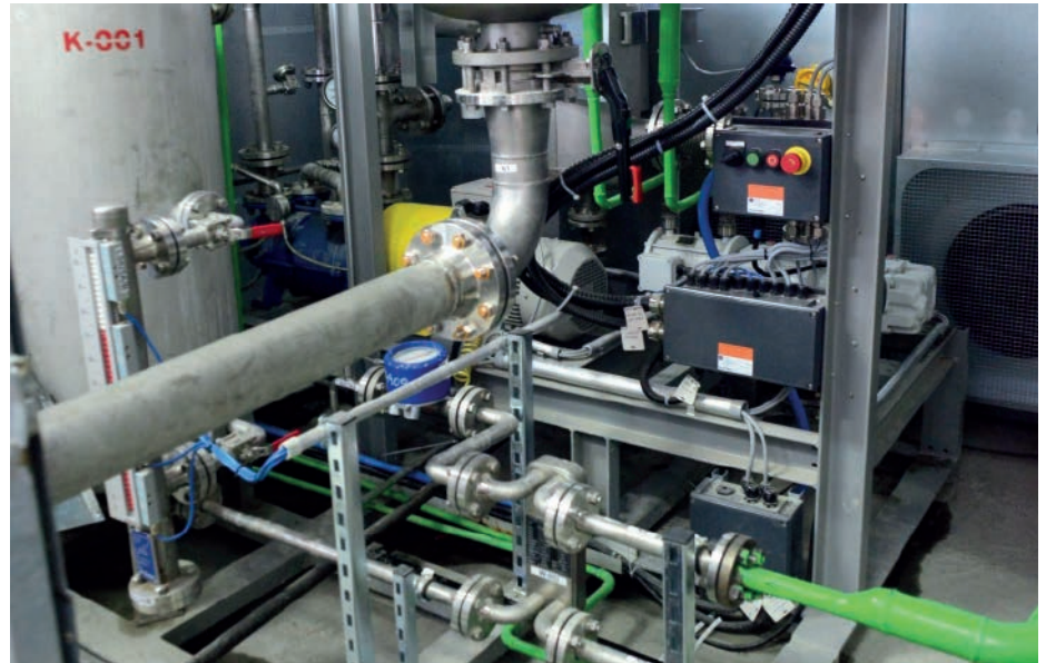
Abb. 4 Einbindung der MSR und des Kraftstromteils über lokale Klemmkästen