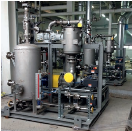
Abb 3: Vor dem Einbau

stellt werden. Eine fördert einen Volumenstrom von 1244 m 3 /h bei 0,4 mbar (a) (PS 1), eine weitere einen Volumenstrom von 1175 m 3 /h bei 10 mbar (a) (PS 2). Der Aufbau von PS 1 ist in Abb. 1 schematisch dargestellt. Die beiden Vakuumanlagen PS 1 und PS 2 arbeiten unabhängig voneinander in nacheinander gelagerten Prozessschritten. Beide Anlagen sind redundant ausgeführt, eine jeweils zweite Anlage wird betriebsbereit gehalten, um in jedem Fall die Kontinuität des Polymerisationsprozesses zu gewährleisten.